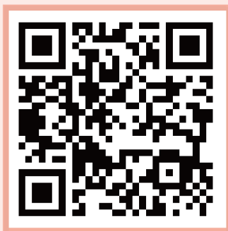
【国家开发银行专区页面二维码】